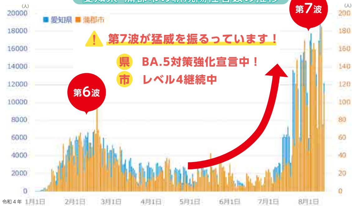
愛知県・蒲郡市の新規陽性者数の推移

蒲郡市内でも新型コロナウイルスの感染が広がり、新規陽性者数も急激に増加しています。ワクチン追加接種の検討、感染対策を引き続きよろしくお願いいたします。