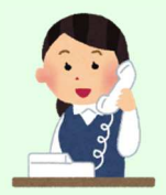
Centro de llamada