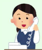
Tổng đài viên