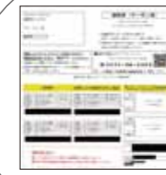
接種券(クーポン券)